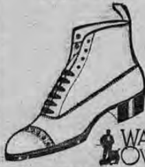
El esperado surtido del famoso calzado americano

A pesar de la guerra Europea este almacén sigue recibiendo las últimas novedades de la moda de Francia, Inglaterra, Italia y Estados Unidos y continúa sus ventas sin ningún recargo en los precios.